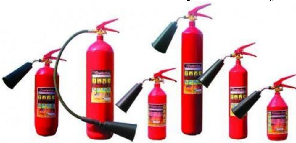
Огнетушители углекислотные (ОУ)