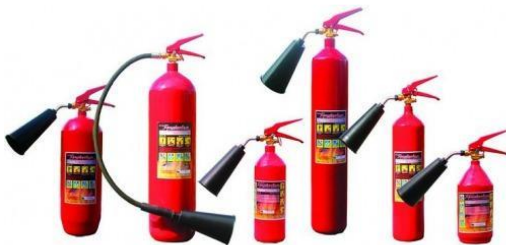
Огнетушители углекислотные (ОУ)