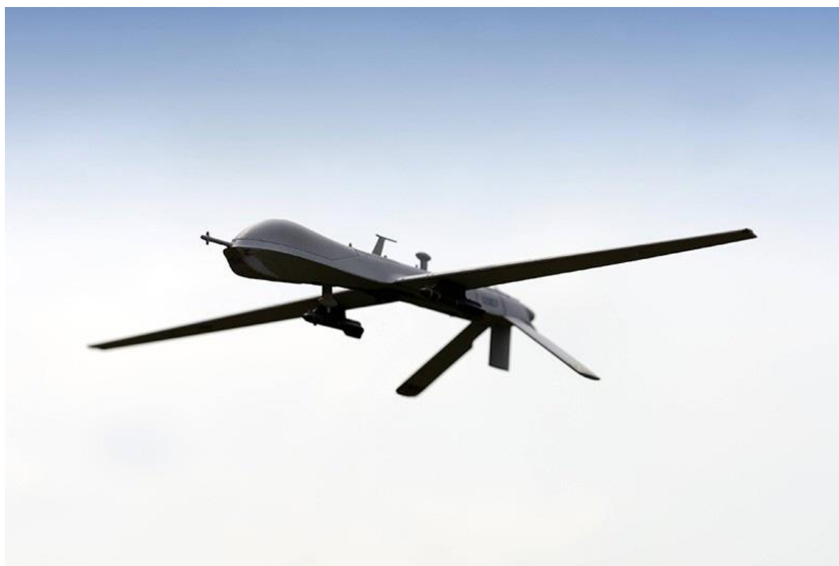
БПЛА самолетного типа (классическая схема).

Существует несколько аэродинамических схем самолетных БПЛА. Основные аэродинамические схемы – классическая и «летающее крыло».