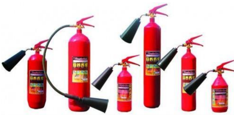
Огнетушители углекислотные (ОУ)